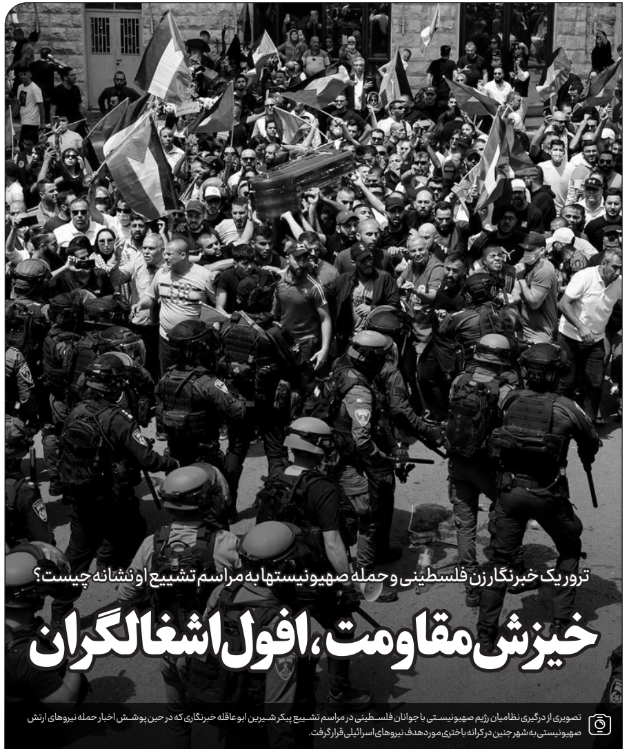
ترور یک خبرنگار زن فلسطینی و حمله صهیونیستها به مراسم تشییع او نشانه چیست؟

رژیمی که روزی خواب و خیال حاکمیت و تسلط بر کمربند طلایی غرب آسیا (از نیل تا فرات) را داشت، از دو دهه قبل تا به امروز مجبور شده روزه روز دیوارهای بیشتر و بیشتری را در اطراف خود بکشد تا مگر در کنار یک ماشین نظامی و ستون های بتنی، امنیت را در سرزمین های اشغالی به ارمغان بیاورد. مدعیان نیل تا فرات امروز از سوی مصر و اردن و غزه و کرانه باختری و نوار مرزی لبنان خود را محصور کرده اند و در کنار این حصارها و دیوارها، تخت گاز بر ماشین جنگی شان می تازند. مقایسه وضعیت امروز با چند دهه قبل که ارتش صهیونیستی یک تنه به جنگ با ارتش چند کشور عربی می رفت و پیروز بیرون می آمد، نشان می دهد که معادلات سیاسی و بین المللی تا چه اندازه به نفع مقاومت تغییر کرده است؛ نشانه هایی که تفاسیر جدیدی از وضعیت آینده این رژیم را پیش روی تحلیلگران قرار داده است؛ نشانه هایی که البته محدود به ترور خبرنگار نماند و در حواشی بعد از خروج پیکر خبرنگار مسیحی فلسطینی از بیمارستان و انتقالش برای ادای ادامه در صفحه ۳