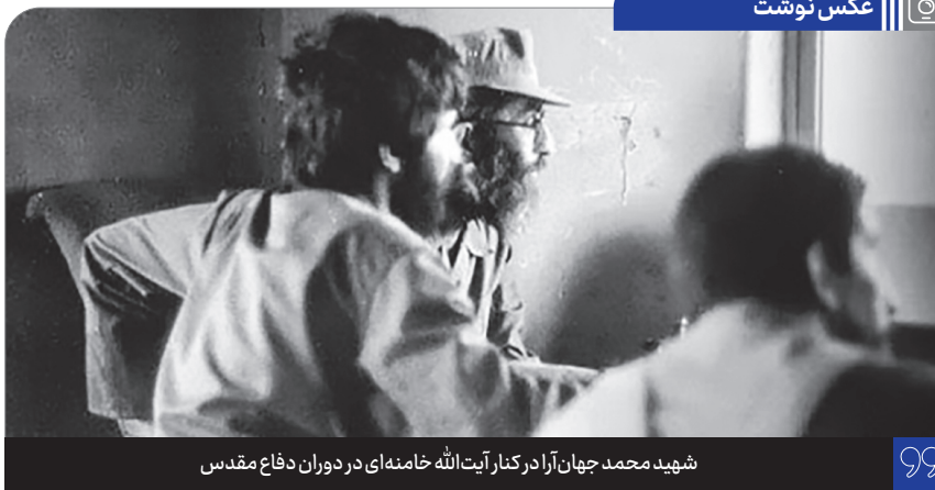
شهید محمد جهان آرا در کنار آیت الله خامنه ای در دوران دفاع مقدس